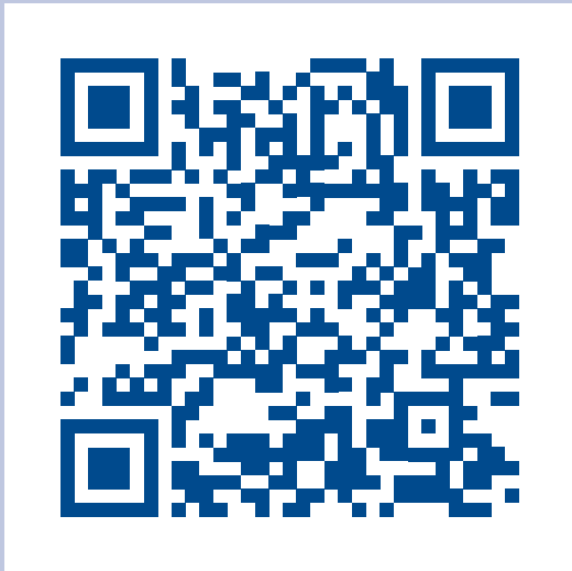
Apple / iOS

Scannen Sie mit ihrem Handy einen der folgenden QR-Codes: